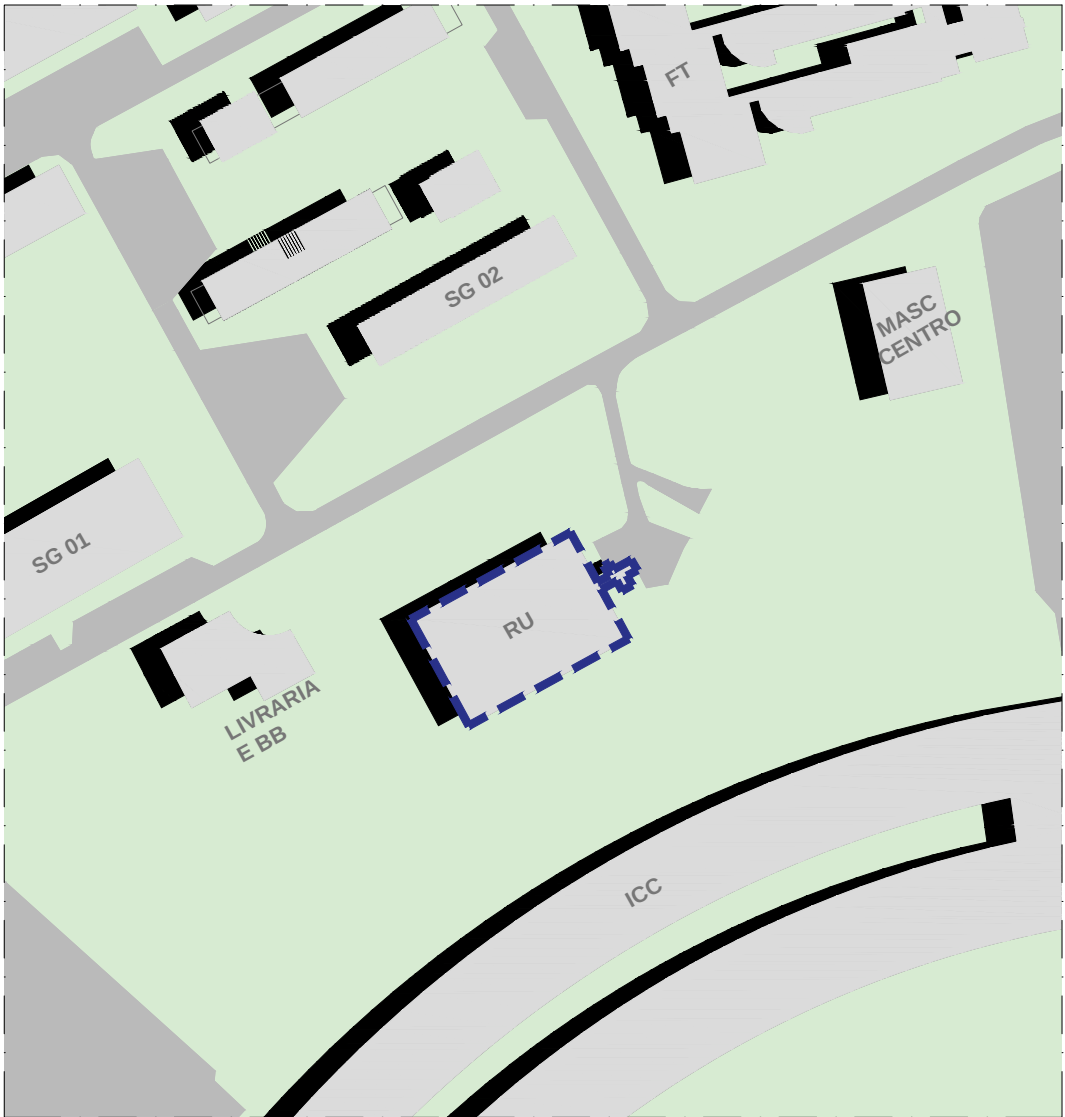
LOCAÇÃO - RESTAURANTE UNIVERSITÁRIO, CAMPUS DARCY RIBEIRO