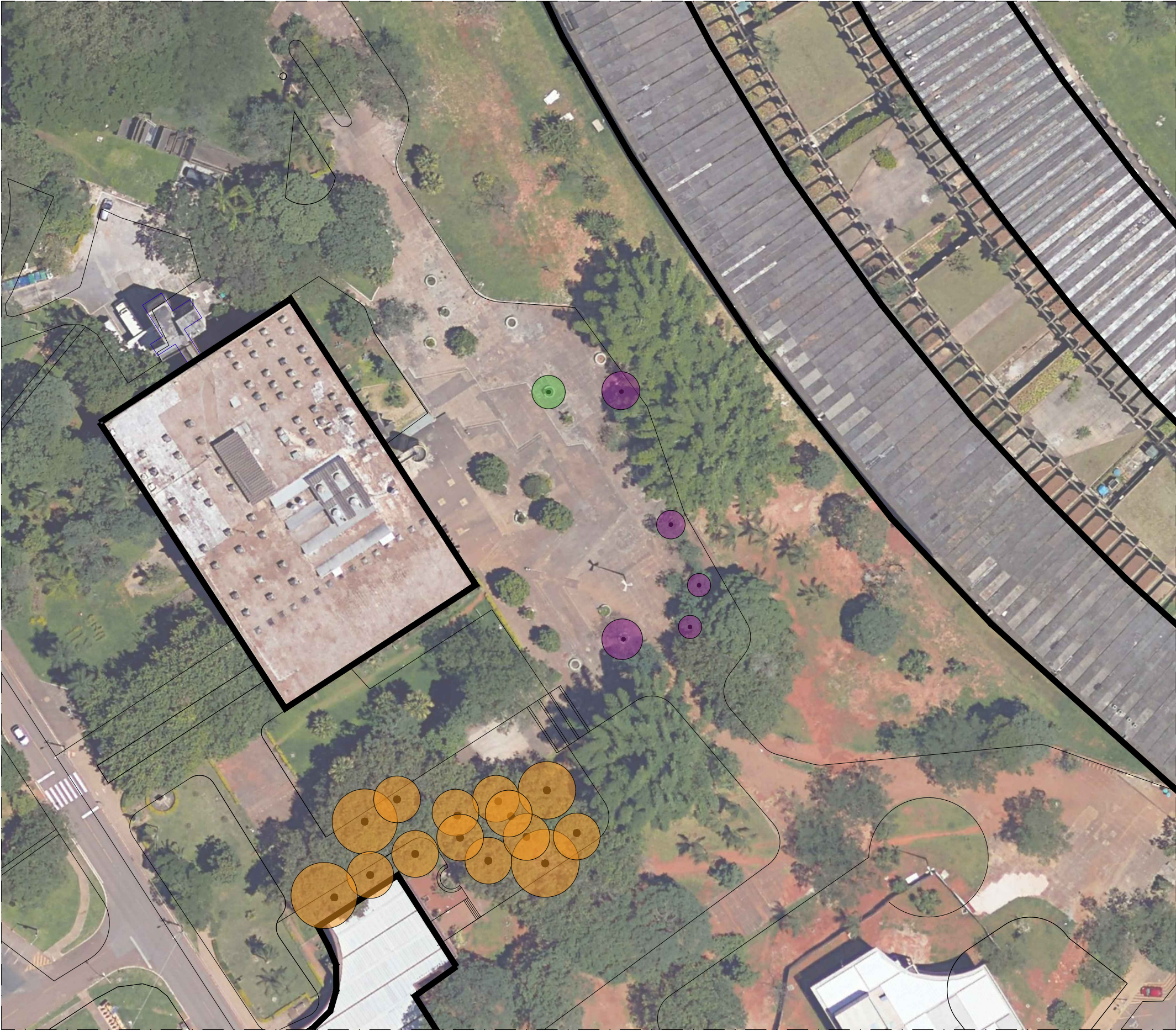
PLANTA DE SUPRESSÃO ARBÓREA