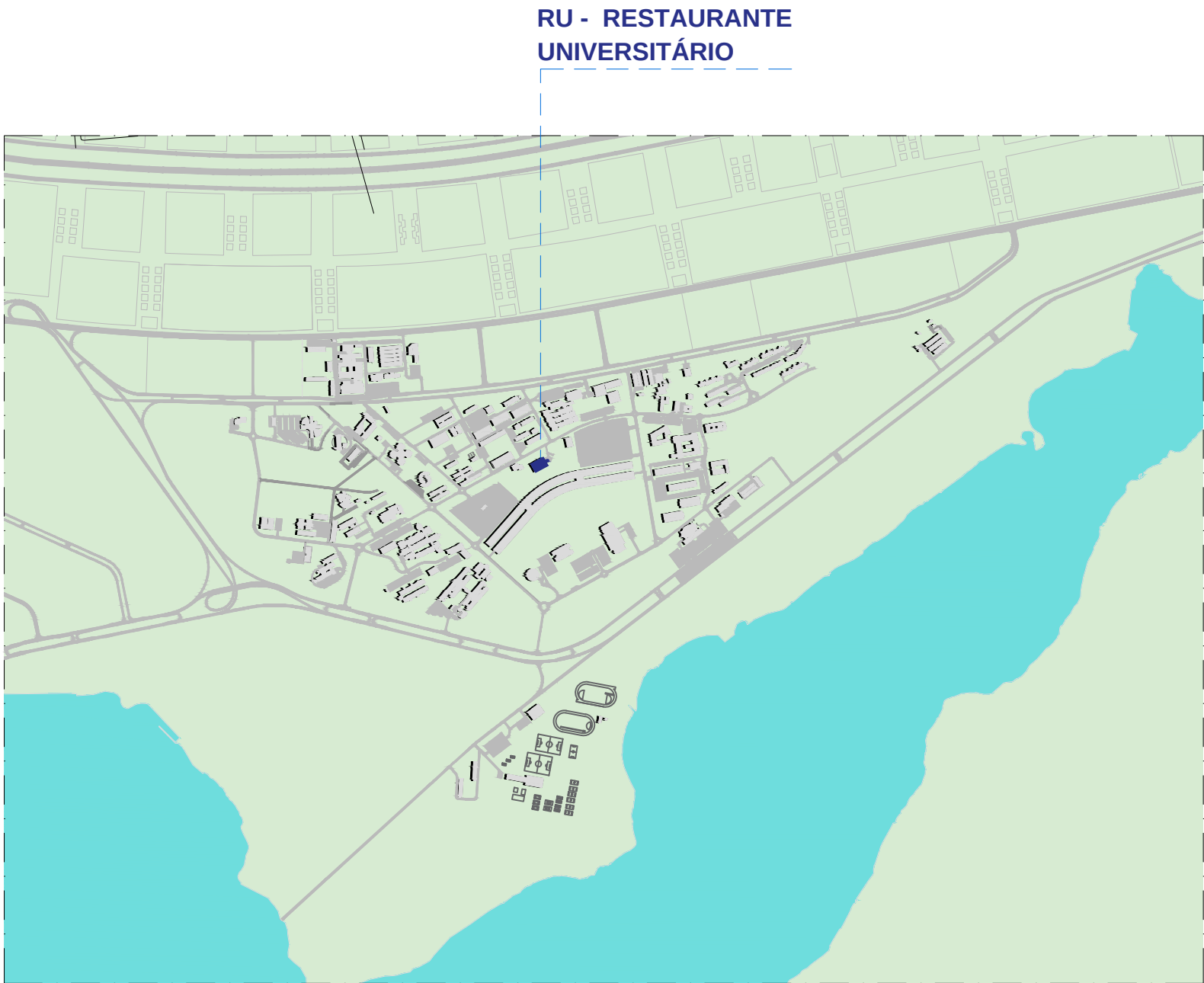
SITUAÇÃO - RESTAURANTE UNIVERSITÁRIO, CAMPUS DARCY RIBEIRO