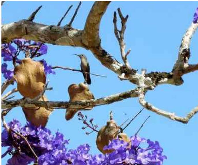
Flor e fruto do Jacarandá

O Jacaranda brasiliana é uma árvore nativa do cerrado que, além da sua beleza excepcional, é resistente ao clima local, longo e proporciona um bom sombreamento. Pode chegar até 10 metros de altura e apresenta floração em tons de lilás, que podem ocorrer em outubro e em maio.